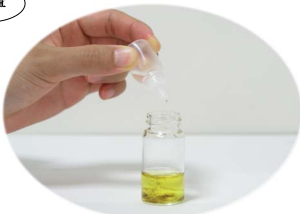
発色液Bを入れ混合します