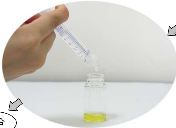
ろ紙を取付けて発色液Aに入れます