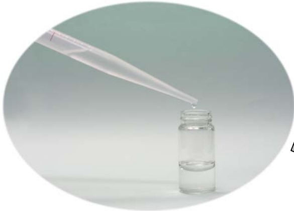
試料油を採取し抽出液に入れます