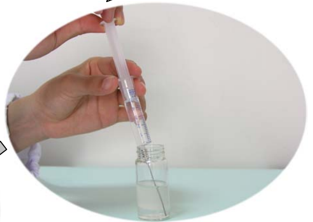
注射器で下層の抽出液を取ります